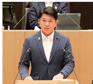
環境委員会 委員長報告

ホームドア設置については、駅利用者の安全確保に資する重要な取組であるため、神奈川県鉄道輸送力増強促進会議を通じて、市内全駅へのホームドア整備について各鉄道事業者に対し要望を行っているところです。京急大師線の各駅については、京急電鉄より、令和6年度から令和8年度にかけてホームドアを整備する予定と伺っています。